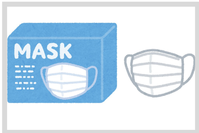
不織布マスク (50枚入)