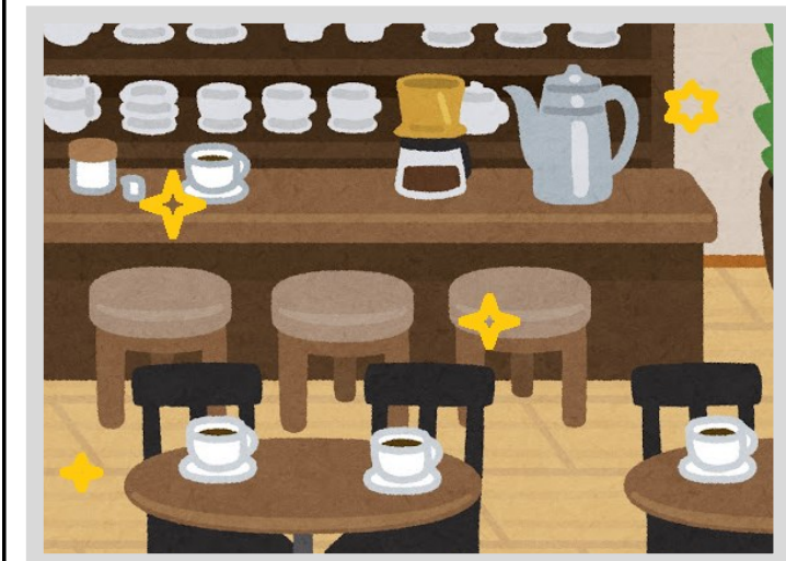
消毒を実施した店舗